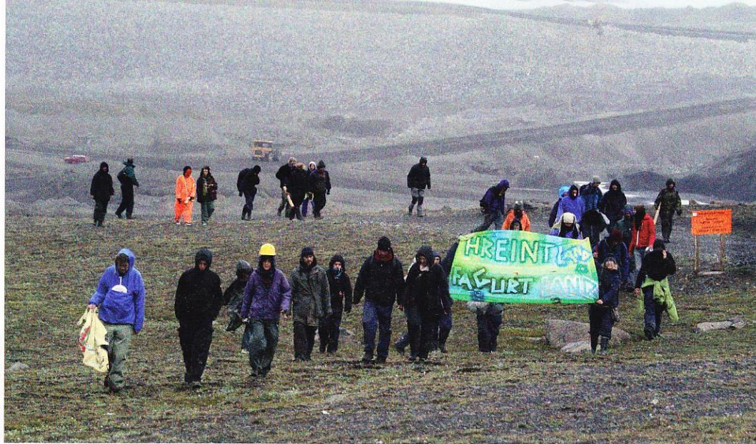
Mótmælendur við Kárahnjúka gerðu sitt besta til að fanga athygli virkjunarmanna og vegfaranda sumrin 2005 til 2007. Það var þó einkum löggæslan sem fylgdist með aðgerðum þeirra. Hér er Desjarárstífla í baksýn.

Í byrjun árs 2003 var haldinn stór mótmælafundur í Borgarleikhúsinu. Hann sótti á tólfða hundrað manna og samtímis kom hópur fólks saman til mótmælastöðu við Lagarfljótsbrú á Fljótsdalshéraði.