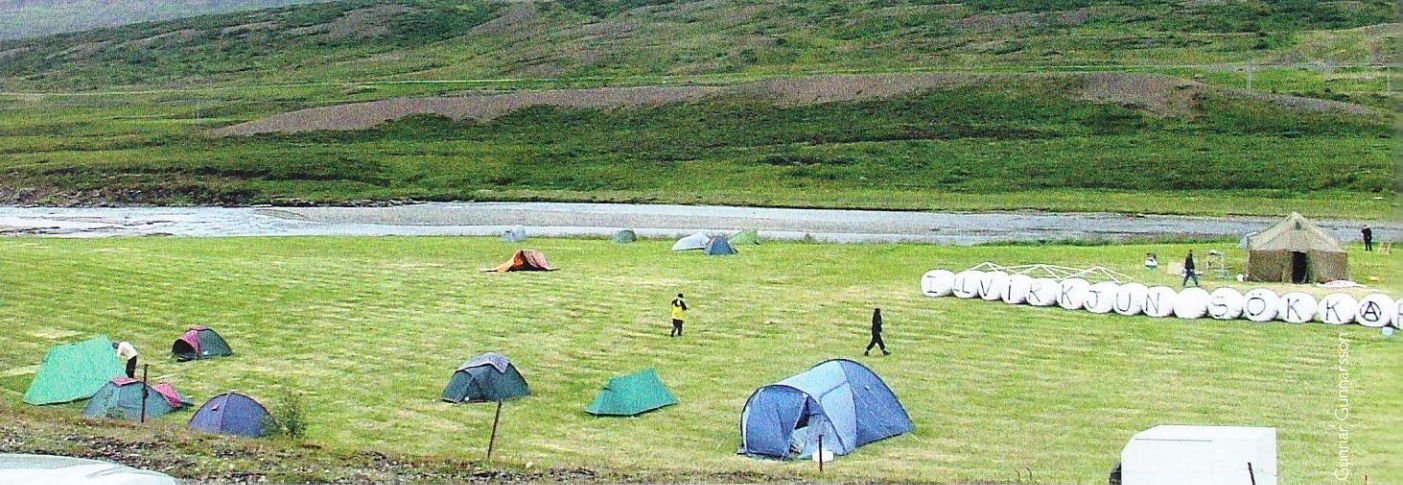
Tjaldbúðir mótmælenda voru um tíma settar niður á Vaði í Skriðdal og kvartaði búðafólk yfir því að lögregla fylgdist með hverju þeirra skrefi.

Reykjavík, þar sem mótmælt var áformum um virkjunarfrankvæmdir og stóriðju.